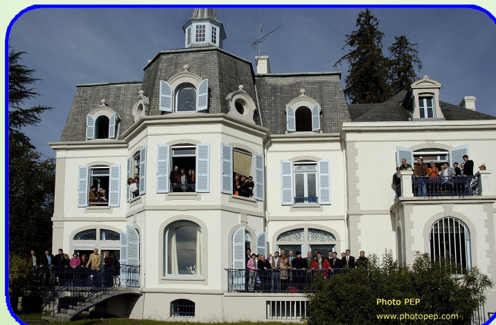
LA VILLA THÉRAPEUTIQUE DU GROUPE BÉARN TOXICOMANIES

PALAIS BEAUMONT DE PAU 15 ET 16 JUIN 2006